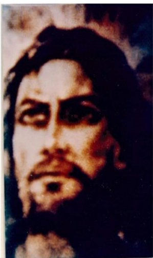
Volto Di Gesù' come Eugenio alcune volte ha affermato di ricordarlo riconducendolo ad alcune sue esperienze. Fotografia fatta da Pino Casagrande a Colma di Valdiggia 13 agosto 1983.

Negli ultimi decenni, Fatima, Garabandal, Medjugorje sono stati luoghi e mezzi dai quali abbiamo ricevuto degli ammonimenti, degli avvertimenti e delle previsioni su come sarà il nostro avvenire.