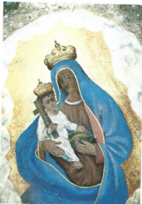
Antico affresco (III sec. d. C.) di S. Maria dell'Adonai che si venera nell'eremo omonimo presso Brucoli (SR)

Domanda: Siamo abituati a pensare alla Madonna come una donna, ma in realtà ci puoi parlare della sua natura spirituale?