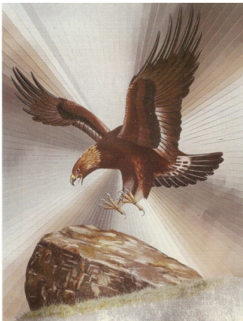
Il salvabile verrà salvato prima che tutto affondi nella melma della totale perdizione di questa generazione. Eugenio Siragusa

Era all'imbrunire. Un gruppo di uomini, donne e bambini uscivano da uno degli edifici bianchi verso una piattaforma circolare che si estendeva davanti. Uscivano in silenzio o parlavano fra se quietamente. Istantaneamente alzavano gli occhi al cielo scrutando le stelle, cercando di scoprire se qualcuna emanava una luminosità particolare o descriveva qualche movimento inconsueto che potesse essere preso come segnale. C'era la luna piena e la campagna odorava di terra in un gorgoglio di germinazione. Era un notte alchemica. Una notte che conoscevano in modo speciale gli Iniziati di tutte le epoche sul Pianeta Terra.